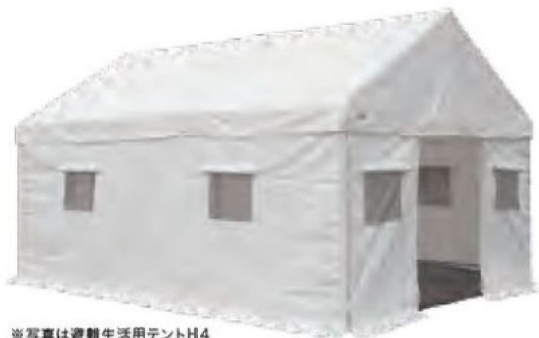
※写真は避難生活用テントH4

災害時の避難生活や宿泊所・救護所等と多目的に利用できる。幕体には防災加工が施され、二次災害の火災にも安心。