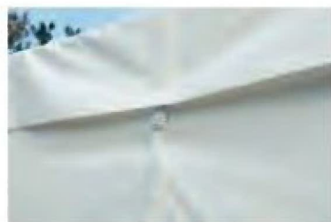
屋根幕のおおりに止め

ウォール4面(8カ所)にフラップ付きのメッシュ窓を装備。ウォールは1面幕で、4隅をファスナーで連結します。