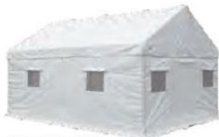
出入口を閉じた状態

災害時の避難生活や宿泊所・救護所等と多目的に利用できる。幕体には防災加工が施され、二次災害の火災にも安心。