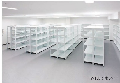
マイルドホワイト