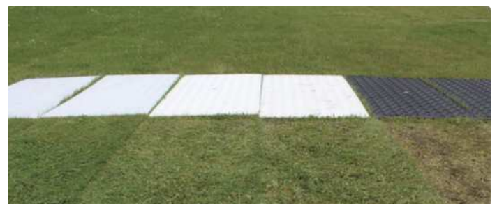
黒よりも白、白よりもクリア色の方が、より芝生への影響が少ないです。