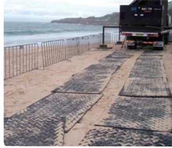
護岸工事(砂地養生)