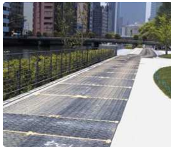
建築現場車両通路