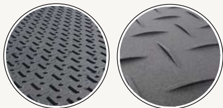
〈表面／細かな縞鋼板模様〉〈裏面／山型模様〉

表面が細かな縞鋼板で裏面が山型模様のリバーシブルタイプ。裏面の山型模様は地盤との滑り止め効果を発揮、表面は歩行者が、より歩きやすいデザインになっています。