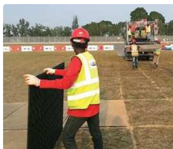
シンガポール空港滑走路拡張