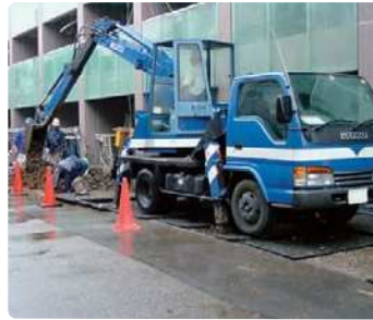
マンション外溝工事