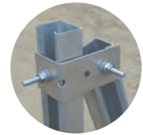
主支柱・控柱接続部