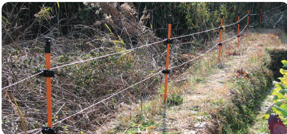
※電線は商品に含まれません