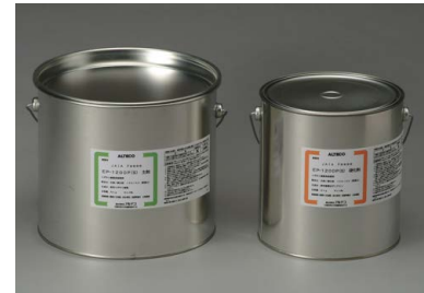
7kgセット (主剤5kg・硬化剤2kg)