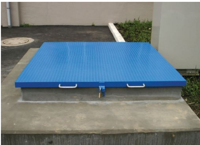
かぶせ蓋施錠タイプ