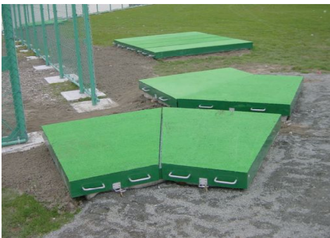
上面加工(人工芝)タイプ