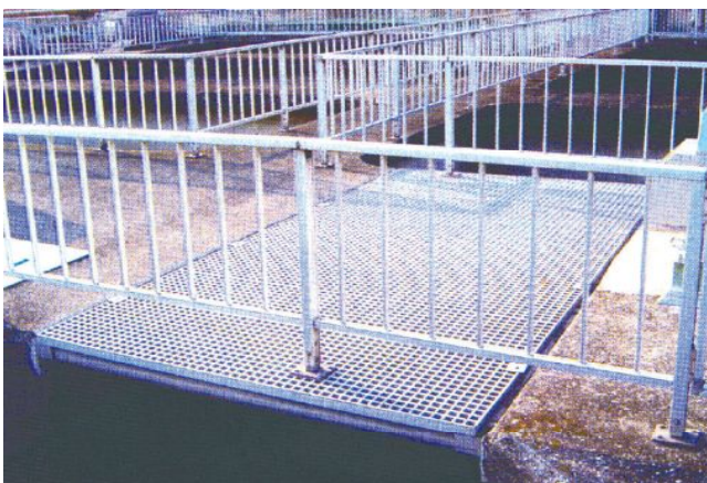
処理槽上歩橋施工例