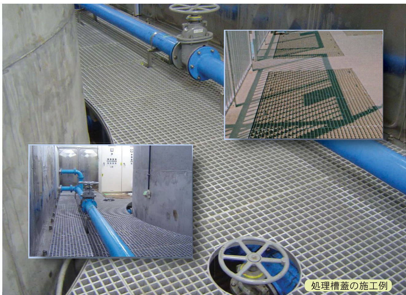
処理槽蓋の施工例