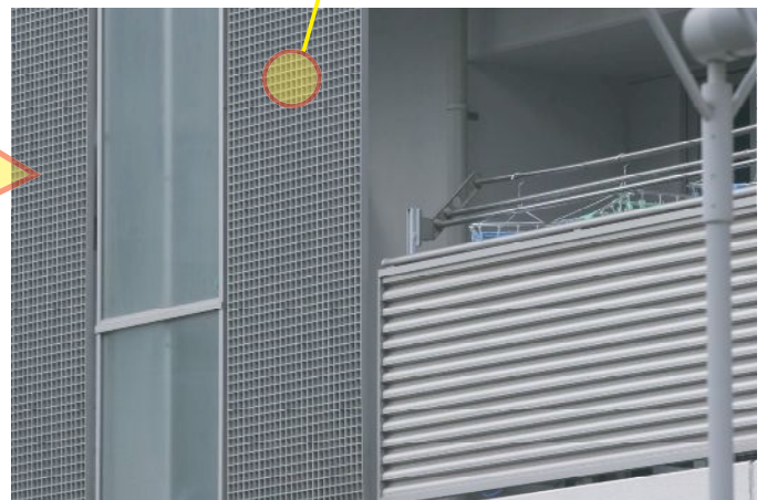
門扉・物置・倉庫目隠し施工例