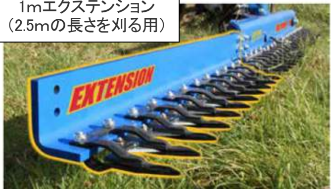
1mエクステンション (2.5mの長さを刈る用)