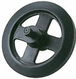
<フロントアイドラASSY> キャリアダンブ