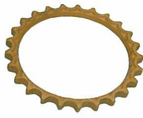
<スプロケットASSY> リム