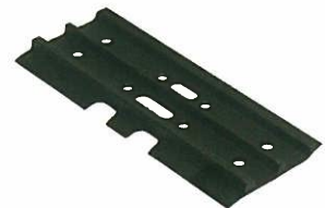
<シュープレート> トリプルグロウサー