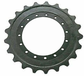
<スプロケットASSY> ボルトタイプ