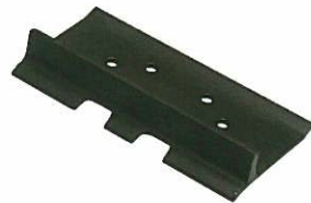
<シュープレート> シングルグロウサー