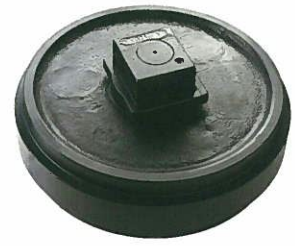
<フロントアイドラASSY> STD