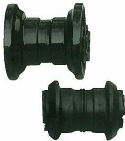
<トラックローラーASSY> 外ツバ (ショベル)