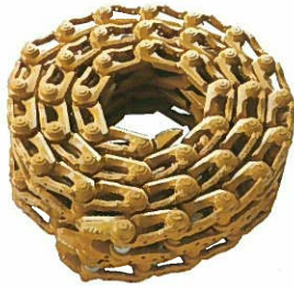
<リンクASSY> オイルタイプ