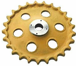
<スプロケットASSY> スプライン