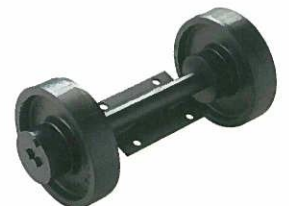
<キャリアローラーASSY> キャリアダンプ