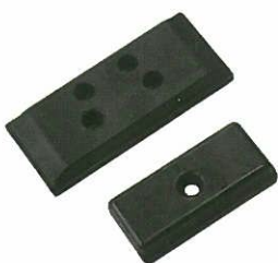
<ゴムパッド> フィニッシャー