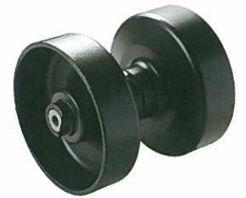
<トラックローラーASSY> キャリアダンプ