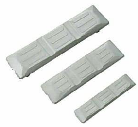
<ゴムパッド> 高所作業車