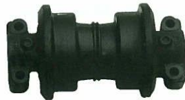
<トラックローラーASSY> 外ツバ (ショベル)