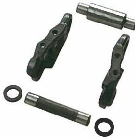
<バラリンク> R・L・マスターピン・ブッシュ