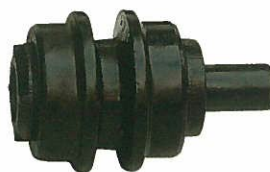
<キャリアローラーASSY> ツバ付き