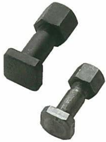
<セグメントボルトセット>