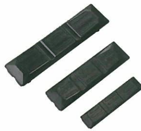
<ゴムパッド> ショベル