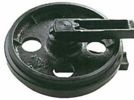
<フロントアイドラASSY> 穴付き