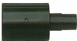
<キャリアローラーASSY> ストレート