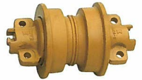
<トラックローラーASSY> 外ツバ (ブルドーザー)