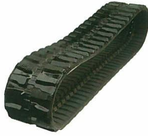
<ゴムクローラ> ショベル