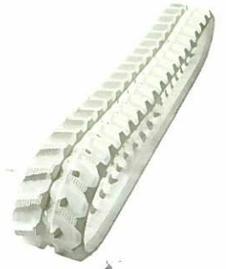
<ゴムクローラ> 高所作業車