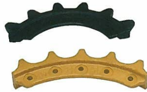
<スプロケットASSY> セグメント