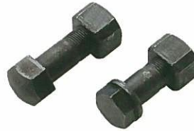
<シューボルトセット>