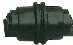
<トラックローラーASSY> 内ツバ