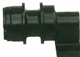
<キャリアローラーASSY> ブラケット付き