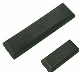
<ゴムパッド> 切削機 (ビルトゲン)