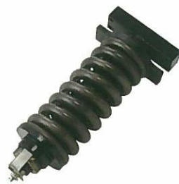
<リコイルシリンダーASSY>