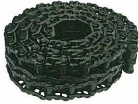
<リンクASSY> シールドタイプ