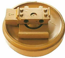
<フロントアイドラASSY> ブルドーザー