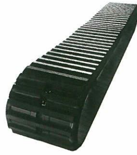
<ゴムクローラ> キャリアダンプ