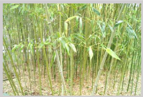
雑木・竹の刈取りに