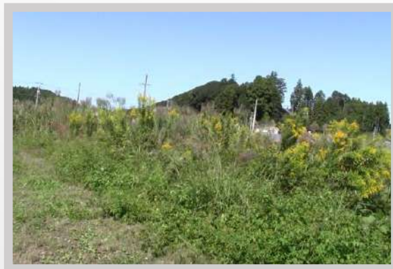
硬く、背の高い草の刈取りに