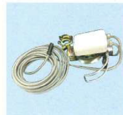
③リミット滑車セット