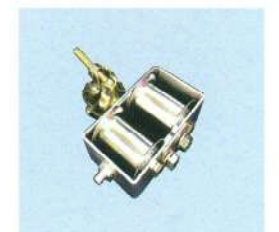
④中間サイドローラー