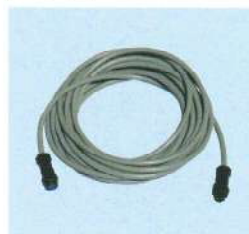
NT中継コード(無線リミット用)