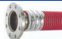
谷埋めフープバンド締 (JISフランジ付き)