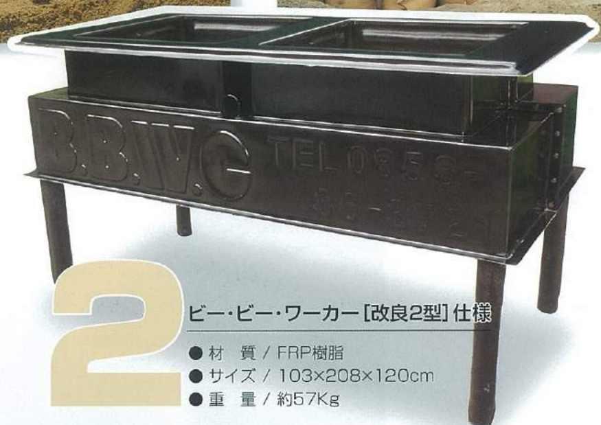
ビー・ビー・ワーカー [改良2型] 仕様